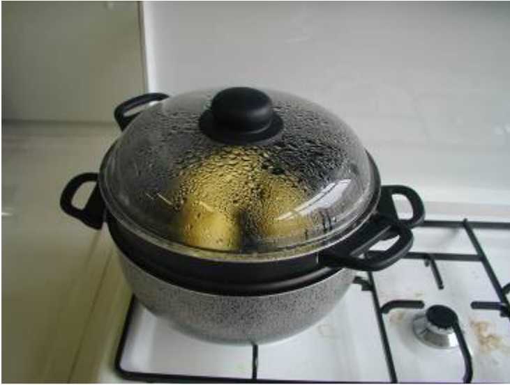
Fig. 2 - Cottura a vapore delle patate