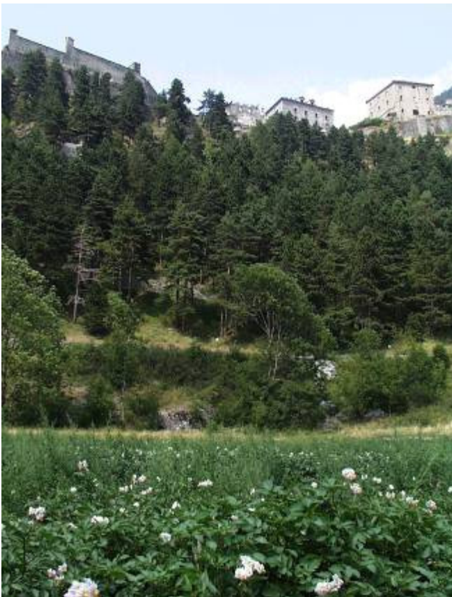
Fig. 3 – Campo sperimentale di Fenestrelle, in località Depot, a valle del forte S. Carlo