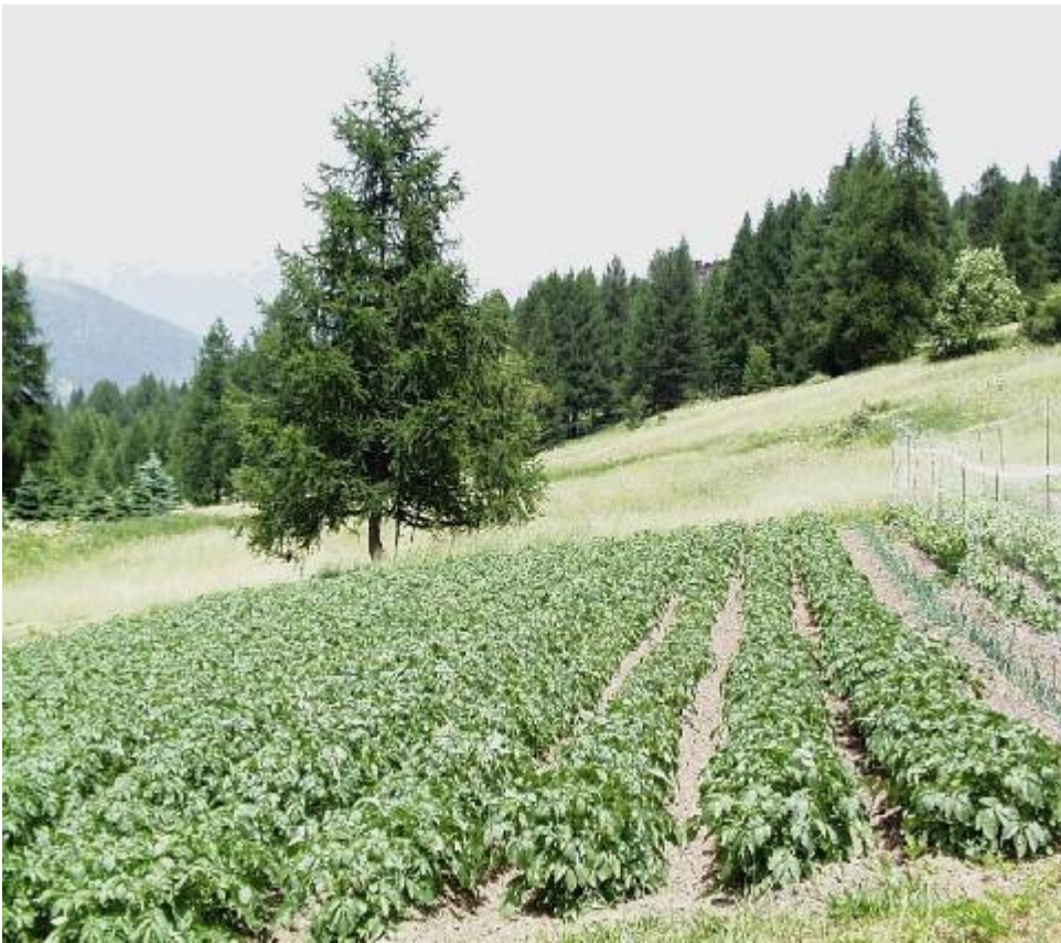
Fig. 4 – Campo sperimentale di Cesana –località San Sicario (TO)